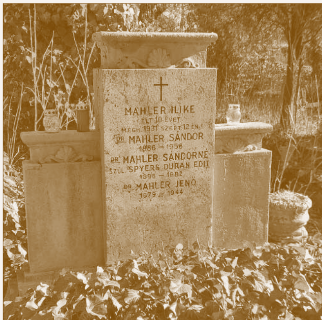
A Mahler család sírja a dunakeszi Kegyeleti temetőben