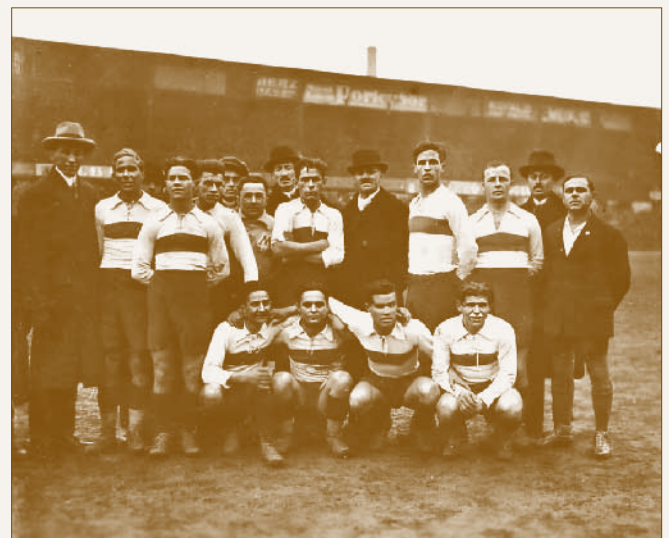
A Dunakeszi Magyarország győztes csapata a döntő után