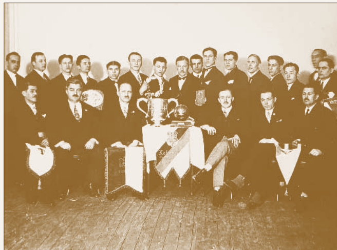
A serlegátadó ünnepély résztvevői