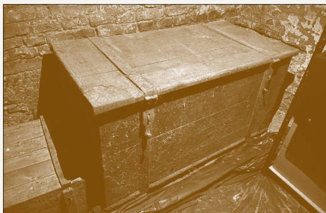
A láda napjainkban