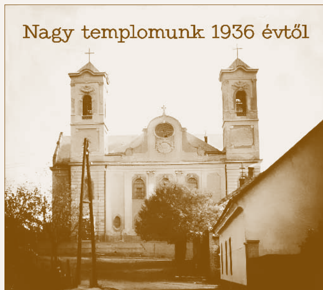
A Szent Mihály-templom az 1936-os bővítés után

Ezen összegek állottak rendelkezésünkre, amikor 1936 pünkösdjén megtettük az első kapavágást [43.], hogy másnap meginduljon teljes erővel az építkezés. Az alapok ásásánál azonban meglepetés ért bennünket. A templomot nem lehetett az eredeti tervek szerint abban a hosszúságban megépíteni, melyben óhajtottuk volna. A főhajóból el kellett hagyni egy ablaknak megfelelő ívet, ami 5 métert jelent, s a szentélyt is két méterrel kellett a sekrestyével együtt megrövidíteni. A szomszédos házak és a templom között 10 m[éter] es távolságot kellett utcának meghagyni. Fájó csalódás, bele kellett nyugodni. A templom így is arányaiban kiadás, hisz nem pár évtizedre épül. 1936 októberében már készen is állott nyersen az új templom, sőt a men[n]yezet gipszmunkája is készen volt.