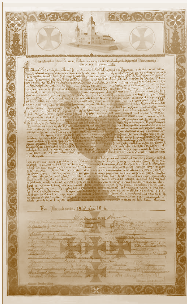
A kibővített Szent Mihály-templom 1937-es alapítólevele

A püspök úr négyesfogaton jött Vácról, igazán pompás látvány volt, kár, hogy egyetlen fényképfelvétel sem sikerült, a kis gép nem tudta a hosszú kiterjedést egy lencsére, illetve lemezre venni. Az autó korszakában a régi szép magyar élet egy gyönyörű formában való visszaidézésre volt ez. 67 A templomról a legjobban nyilatkozott és örült, hogy biztatása, mellyel elindított a plébánia vezetésének megbízása alkalmából – ilyen hamar valósággá lett. Sok értékes tanácsot és biztatást adott, hálás vagyok érte. [50.]”