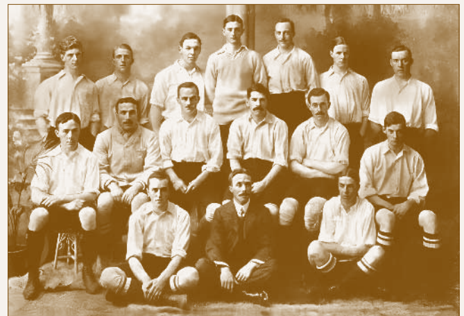
A Corinthian FC Magyarországra érkező csapata