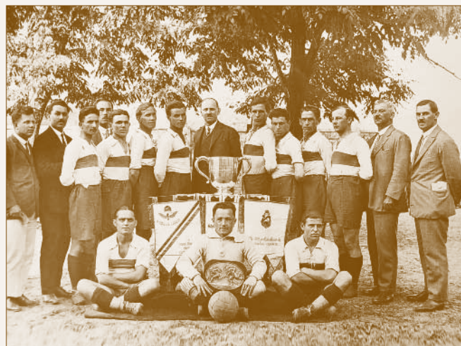
A Dunakeszi Magyarország Corinthian-díjat nyert csapata

A Dunakeszi Magyarország SE labdarúgói a csapat történetének kezdeti szakaszában vívták ki a díjgyőzelmet, amely az együttes legnagyobb sikerei közé tartozott. Figyelmet érdemel, hogy a Corinthian-vándordíjért folytatott küzdelmeik során a sporttudósítók mindvégig hangsúlyozták: a dunakesziek a játék örömeért játszanak és mindig szem előtt tartják a fair play szabályait – ez az igazi „Corinthian lélek” megnyilvánulása.