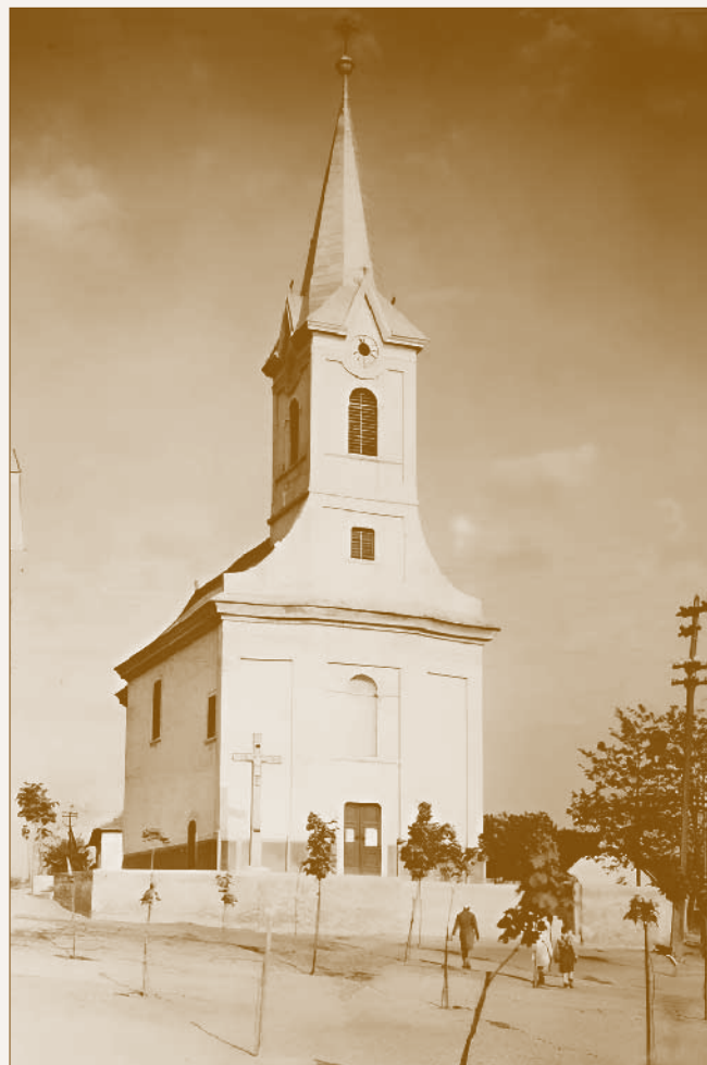
A még egytornyú Szent Mihály-templom az 1936-os bővítés előtt