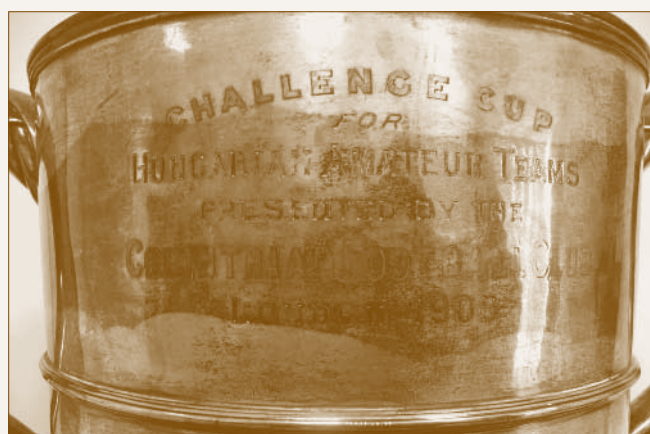
A serleg és a rajta szereplő felirat