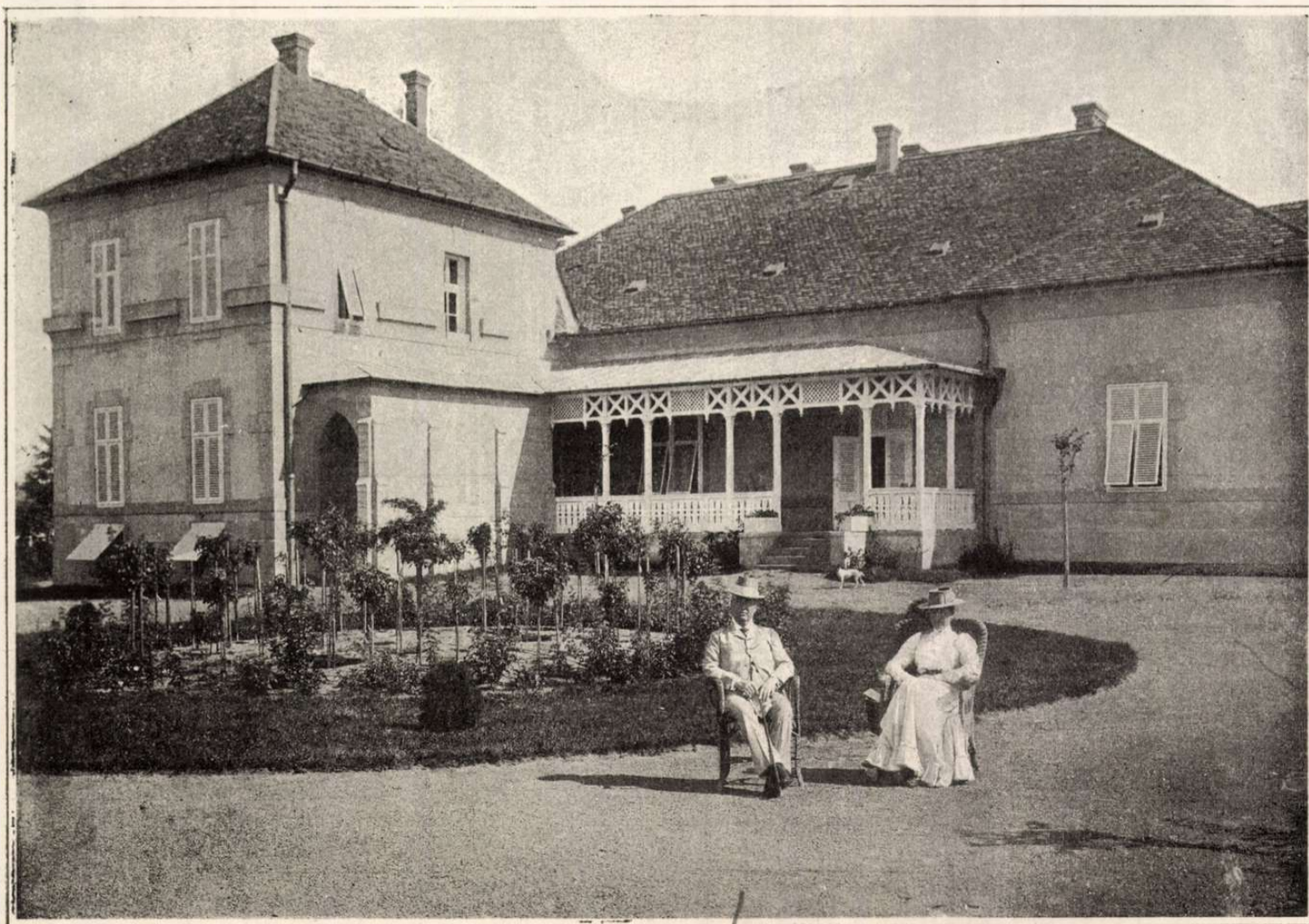
REEVES MESTER OTTHONA.