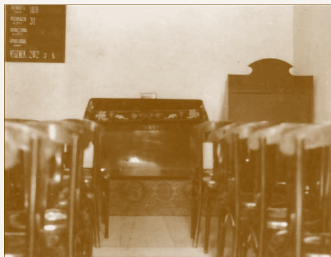
Az imaház kívül és belül az 1940-es évek első felében