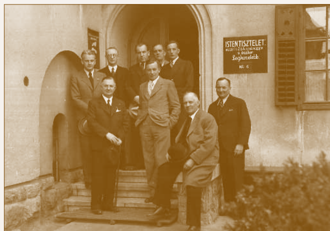
Külföldi vendégek a gyártelepi református imaterem előtt