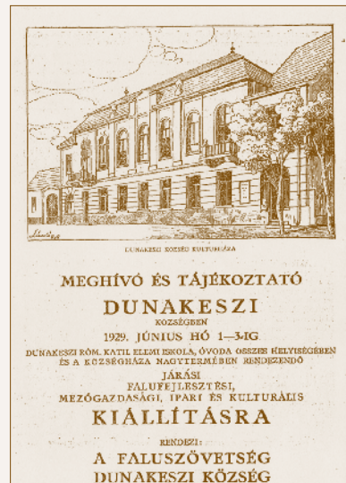
A dunakeszi kiállítási meghívó