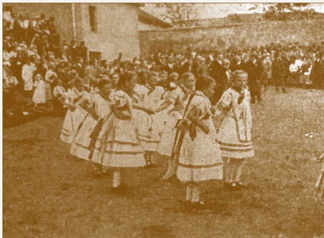
Magyaros díszítésű fehér ruhába öltözött földműves gyerekek csárdást táncolnak Dunakeszin