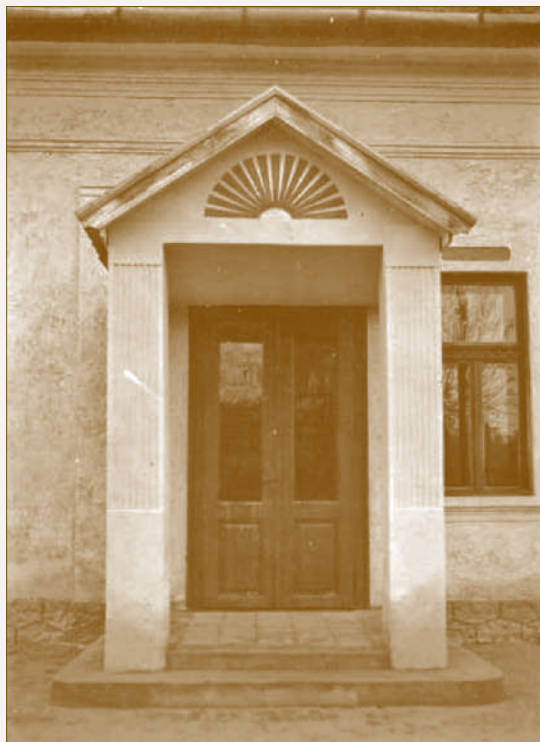
A református imaház bejárata az 1930-as évek közepén

kongresszusát semmilyen bántó hanggal ne zavarják meg. „[...] öntudatos református és evangélikus keresztyén ember ezzel az ünnepeléssel semmiféle lelki közösséget nem vállalhat, mert az oltári szentségről szóló római katolikus dogma hitünk tanításával merőben ellenkezik.”