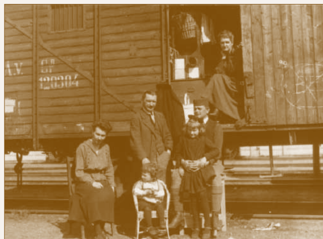
Menekült család szállása egy pályaudvaron álló tehervagonban

A következőkben a Dunakeszire és Alagra került menekültek listáját közöljük. Ahogy fentebb már említettük, a két település közös vasútállomása fontos pontja volt a fővárosba tartó emberáradat regisztrációjára és elszállásolására kijelölt helyeknek. Arról, hogy az ide érkezett menekültek közül hányan telepedtek le végleg a két községben, nincsen adatunk, de az itt közölt névsor alapján a közeljövőben talán erre is választ kaphatunk.