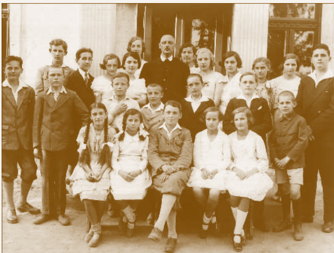
Református konfirmáltak Dunakeszin az 1930-as években