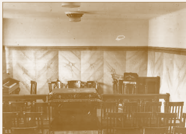
A dunakeszi főműhelyi lakótelep református imaterme

Az 1933-as esztendő első közösségi alkalmát január 6-án, vízkereszt napján tartotta a gyülekezet. A Református Napot a Kossuth Lajos utcai Kultúrház (Tolnai-vendéglő) nagyter-