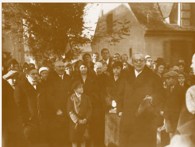
Ravasz László püspök a Műhelytelepen

Az 1933-as esztendő első közösségi alkalmát január 6-án, vízkereszt napján tartotta a gyülekezet. A Református Napot a Kossuth Lajos utcai Kultúrház (Tolnai-vendéglő) nagyter-