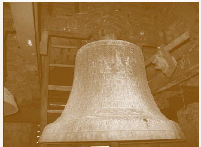
A nagyharang a Szent Mihály-templom északi tornyában