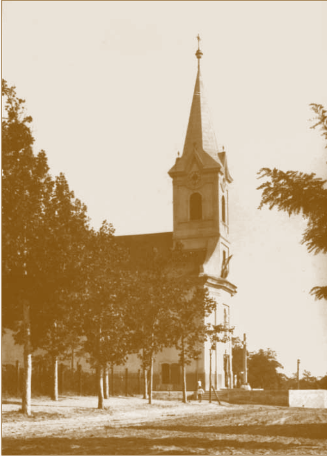
Az öreg Szent Mihály-templom 19

„Öntetett Szent István király tiszteletére, öntötte Walser Ferenc, Budapesten, 1892. 2044. sz.” 18