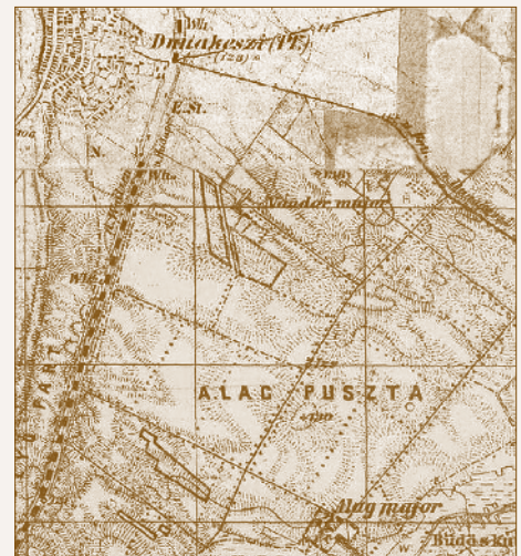
Alagpuszta az 1890-es évek végén

A tréningtelep létrejöttének, illetve a versenyek vonzerejének hatására lassan megtelt az új lovas létesítmény, valamint kezdett benépesedni a korábban lakatlan alagi pus- ta is. Természetesen a népesség illetve a látogatók számának növekedése befolyással volt az infrastruktúra, valamint az épületállomány (nem csak közvetlenül a lóver-