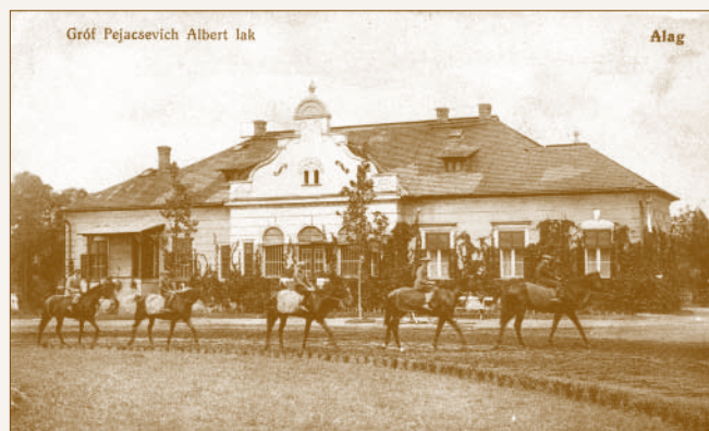
A Pejácsevich telep kúriaépülete

A kúriaépület a lóversenypálya legigényesebben kialakított idomárlakása. Földszintes épület, tömegformája eredetileg szimmetrikus kialakítású volt, később déli sarkán rizaliktént előrelépő helyiséggel bővítették. Udvari homlokzata középrizalittal tagolt, a kiugró épületrész félköríves nyílásokkal megvilágított fedett veranda. Ez az átmeneti tér eredetileg díszes vonalvezetésű oromfalas kialakítású volt, ma kontyolt tető fedí. A téglapépület vakolt felületképzésű, ablakait egyszerű díszítmény keretezi. 2006-os felmérés alapján hat lakás található benne.