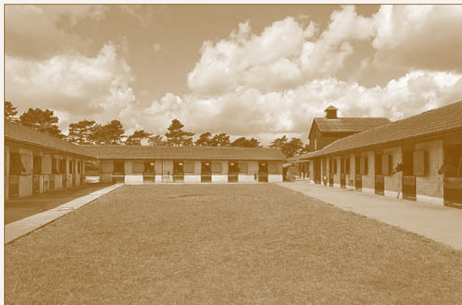
Newmarketi istállók napjainkban

meghatározott rendben sorakoznak Newmarket dél-nyugati határánál. Sokkal kisebb telkeken épültek, mint elődeik, és beépítési sémájuk sem követi a hagyományokat.