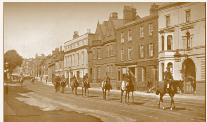
A High Street 1895-ben

Newmarket már a középkorban is létező vásárváros volt a forgalmas Londont és Norwich-et összekötő Icknield út (ma: High Street) mentén. A város mindaddig viszonylag jelentéktelennek számított, amíg a 17. században a vadászat és lovak iránt rajongó I. Stuart Jakab fel nem fedezte a környék lejtőiben rejlő lehetőséget és mondhatni második székhelyévé nem tette. A királyi udvar időszakos idetelepülésével és ezzel egyidőben a „lópróbák” szorgalmazásával a településen gombamód szaporodni kezdtek az előkelő arisztokrácia által finanszírozott versenyistállók. A város ezzel elindult a máig elsődleges profilját meghatározó versenyló-tréningközpont kialakulásának útján.