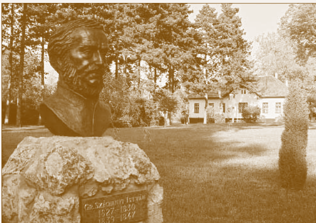
Az alagi tréningtelep napjainkban