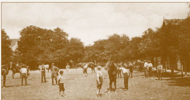
Az alagi Planner-istálló az 1900-as évek elején

senyhez kapcsolódó) kiépülésére is. 1910-re Alag már 1624 lelket számlált. Ez a nagymértékű fejlődés legfőképpen a Lovaregylet áldásos munkájának volt köszönhető, amelynek támogatásával sorra épültek a lóverseny „üzemet” kiszolgáló, illetve a növekvő Alag településrészt fejlesztő intézmények (vasútállomás, csendőrség, cselédlakások, villanegyed, iskola, községháza). 1910-ben Alag különvált Dunakeszitől. Amíg Alag hihetetlen mértékben fejlődött, a tréningtelep végleg megtelt, elérte maximális kereteit. A Pest Megyei Levéltár adatai szerint 1912 márciusában 47 mén, 123 csikó, 82 kanca, 130 kanca csikó, 67 herélt, és 9 herélt csikó volt Alagon. Összességében elmondható, hogy a mai Alag városrész létrejöttét a lóverseny intézményének köszönheti, a tréningtelep pedig meg sem közelíthette volna az elért színvonalat a községben kialakult kulturális, társadalmi és szakmai közeg nélkül.