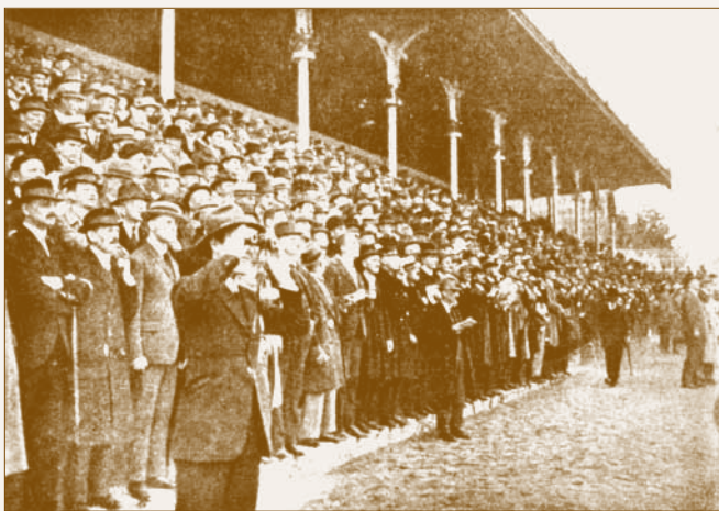
Az alagi nagytribün közönsége az 1900-as évek elején

A világháború súlyos károkat okozott mind a község mind a lóversenypálya életében. Alagról és Dunakesziről mintegy 549 főt soroztak be néhány hét alatt. A változások egyaránt érintettek lovászt, segédmunkást, trénerket, istállótulajdonosokat, iparosokat. A lóversenyek egy évig szüneteltek, az 1915-ben újrakezdődő versenyek azonban sem minőségben, sem mennyiségben nem közelítették meg a korábbiakat. Sajnos konklúzióként levonható, az első világháború azon felül, hogy megtizedelte a lakosságot, elvette Alagtól azt a lehetőséget, hogy a lóversenysport tekintetében európai szerepet játsszon.