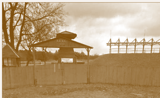
Az alagi versenypálya bejárata napjainkban

Az alagi intézmény több mint egy évszázada Magyarország egyetlen „versenyló tréningtelep” funkciót betöltő épület-együttese. A második világháború után területe jelentősen csökkent, ma körülbelül 120 ha.