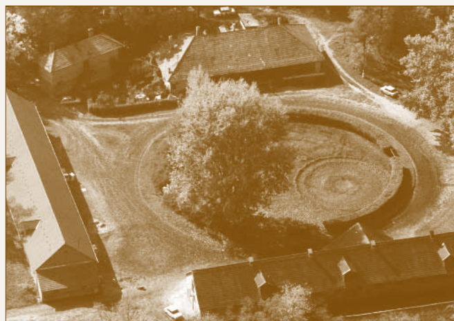
Az alagit tréningtelep egyik egysége

Az alagi tréningtelepen található gazdasági egységek beépítésüket tekintve teljes mértékben megegyeznek a Newmarketben a 18. század közepén épült példákkal. Egy gazdasági egység, ahogyan azt már említettem, a trénerlakás - lovászlakás - istálló elemekből épül fel. Ezek az egységek sorakoznak a mesterségesen szerkesztett raszter rendszerű lovas úthálózat mentén. A kúriák, istállók és lovászlakások építészeti formálása telepről telepre változik. A telepeket a trénernek után nevezték el, egy udvarban a második világháborúig több idomár is megfordult, ezért egy épületegyüttes több nevet is viselt az évtizedek alatt.