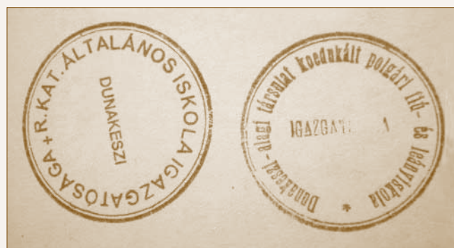
A katolikus és a polgári iskola pecsétje