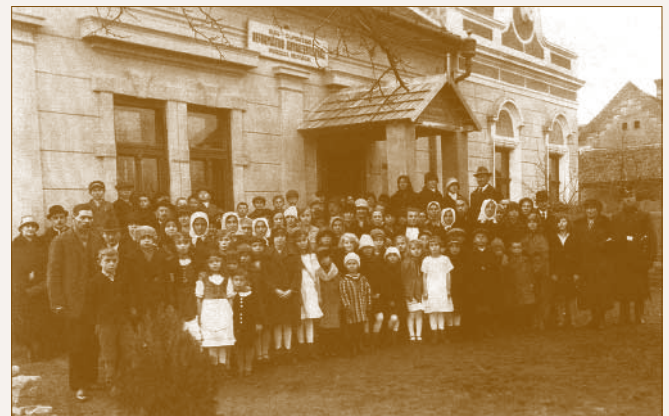
A Szent Mihály utcai imaház