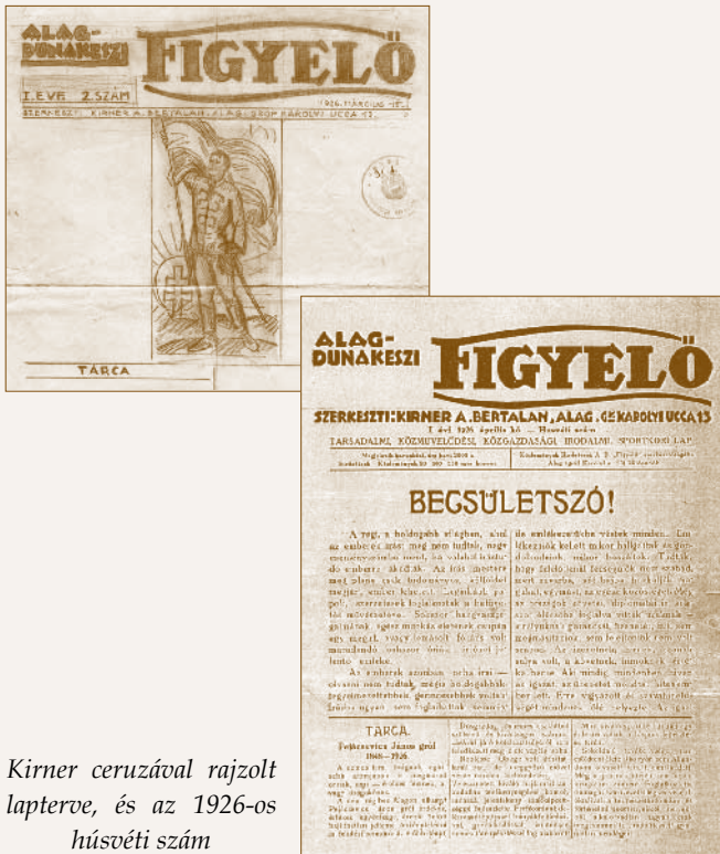
Kirner ceruzával rajzolt lapterve, és az 1926-os hűsövéti szám

egy lapszám van az archívumunkban, több példányról nem tudunk. Egy 1926 decemberében kelt levélben a Belügyminisztérium Sajtóosztálya közölte, hogy az újságot – előzetes engedélyeztetés hiányában – betiltja.