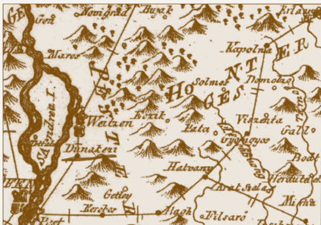
Postaútvonalak térképe 1789-ből

A település 1786-ban kapott postahivatalt. Az 1865 előtti időben, nem a szó mai értelmében vett hivatala, hanem lovasposta-állomása – pontosabban ló-váltó állomása – volt az akkori Dunakesznek, mely a postajáratok első megállóhelye volt Buda és a Felvidék között. Visszaúton hétfőn érkezett a lovasposta Kassa felől a Tornaalja – Gács – Szakáll – Balassagyarmat – Rétság – Vác – Dunakeszi – Buda útvonalon. 3