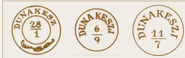
Postai bélyegzők: 1850-57, 1864, 1871