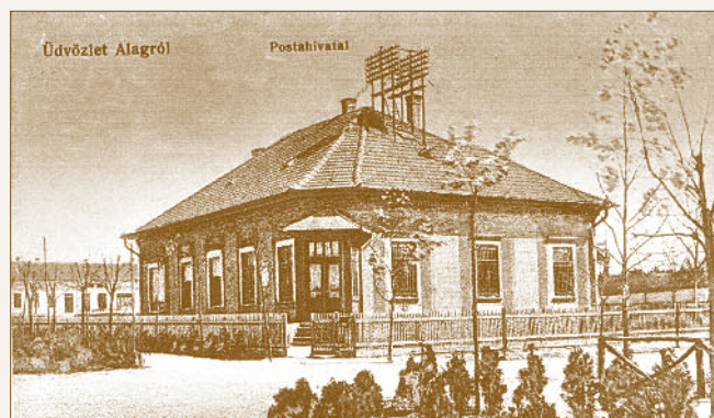
Az alagi postaépület az 1910-es években

A belügyminiszter 59.822/1910. sz. rendelete az addig Dunakeszihez tartozó Alag pusztát – hozzácsatolva Újdunakeszit és az Alagi Villatelepet – „Alag” néven nagyközséggé nyilvánította. 18 A kialakult mozgalmas élethez egy viszonylag jól felszerelt, megfelelő méretű postahivaltal és szolgálati lakásokat építettek fel a mai Verseny utca 4. szám alatt. Az épület a Kincstár tulajdonában volt, a szerződéses postamester bérelte.