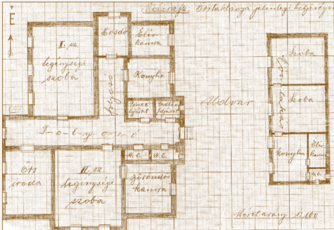
Az alagi csendőrlaktanya alaprajza az 1930-as évek közepén. Jobb oldalon a felépült altiszti lakás.

1933. július közepén az új altiszti lakás megépítéséhez 26 ezer darab téglát a helyszínre szállítottak, s a munkálatokat még az ősszel megkezdték.