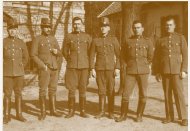
Alagi csendőrök a laktanya udvarán az 1930-as évek végén