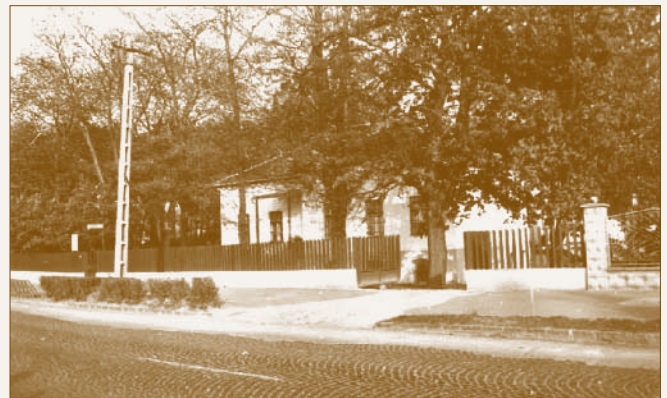
A volt csendőrségi épület az 1980-as években