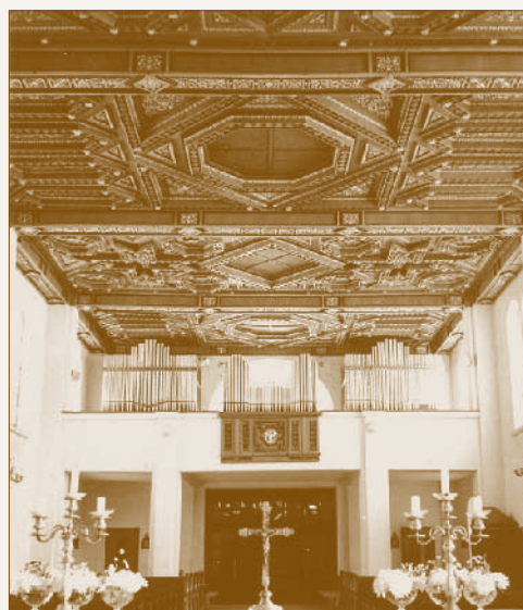
Templombelső az oltár felől nézve

aranyoztatni a sérült részeket. Jó minőségű faanyag hiányában a hiányzó reliefek kifaragása ekkor is elmaradt. 29 Leszkovszky a háború után továbbra is kapcsolatban állt az alagi plébániával, 1948-ban megtervezte a gyönyörűen faragott baluszteres és törpepilléres szentélykorlátot (áldozatókorlátot), 1954-ben ő tervezte az oltár tetején lévő baldachint, 1965-ben pedig elkészítette a szembemiséző oltár és az apszis Szent Imre üvegablakának (lényegében a templom oltárképének) terveit. 30 A stílushasonlóság miatt elképzelhető, hogy a szószék hangvetője szintén Leszkovszky iránymutatása alapján készült, de maga a törtvonalú mellvédű, oszloppal alátámasztott szószék a neves főtí szobrász, Németh Kálmán 1953-as önálló munkája, 31 akár csak az 1955-ben készült keresztelőkút. 32