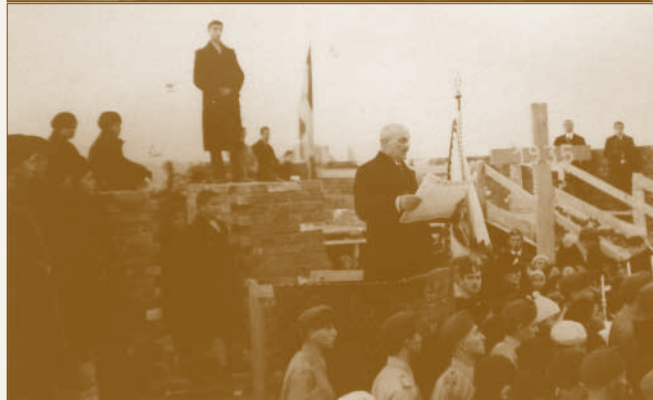
A templom alapfalai és az alapító levél felolvasása 1935-ben