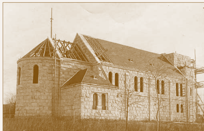
Az épülő templom 1936-ban