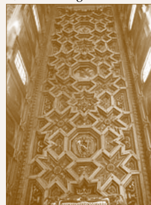
A S.M. in Trastevere főhajójának mennyezet

A Historia Domus ból kiderül, hogy „a templom belső díszítésének vezérgondolata az integer Magyarország” volt. 25 Ezért került a szentély