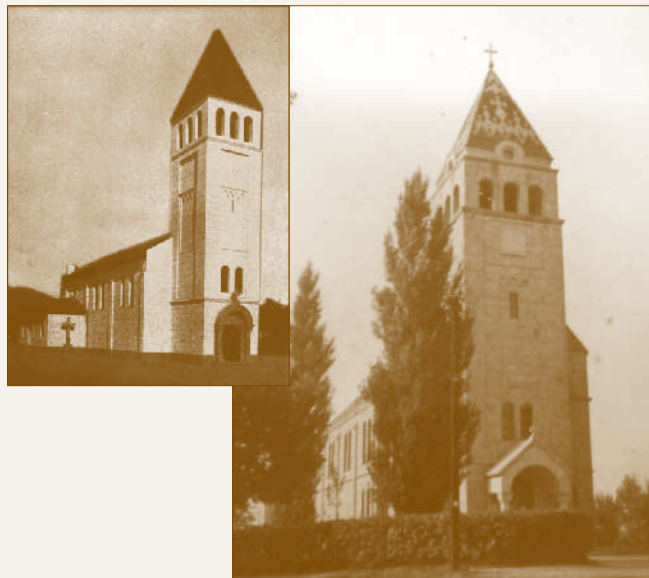
A sződligeti és az alagi templom

szélessége megegyezik a mögöttük lévő hosszházzal. Az ablakoknak nincs kerete, párkánya, lényegében beleolvadnak a külső fal síkjába, kivéve a melléképületek esetében, ahol az építész egy négyzet alakú, süllyesztett falmezőbe helyezte a keret nélküli, félköríves ikerablakokat. Az alagi templom legközelebbi párhuzamának az 1932-ben épült sződligeti templomot tekinthetjük. Térszervezését (tehát az alaprajzát) és tömegalakítását tekintve szinte ugyanolyan a két épület. (Sződligeten nincsenek homlokzati melléktornyok, kevésbé kiugró az árkádós kapuépítmény és hiányoznak az óraablakok, de ettől eltekintve a harangtorony és a hosszház kialakítása azonos