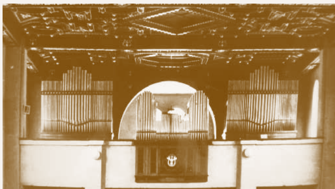
Karzat az orgonával

szintjén négy félköríves záródású ikerablak biztosítja a templom megvilágítását. Az előcsarnok esetében a második szinten lévő ablakok az alsó szinten is megismétlődnek, az apszist pedig három nagyméretű félköríves ablak nyitja meg a külvilág felé. A főhomlokzat a harangtorony és a két melléktorony miatt hármas tagolású. A háromszintes melléktornyok fele olyan szélesek, mint a harangtorony, egy szinttel emelkednek a templom ereszvonala fölé, és az egyes szinteket párkány határolja. A két melléktorony alsó szintjén 1-1 félköríves ablak látható.