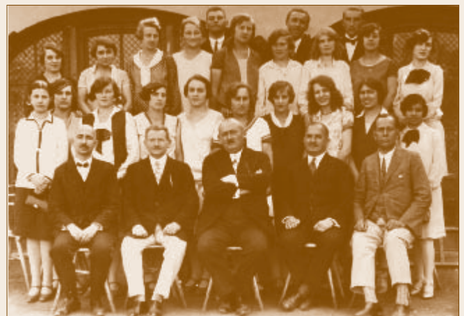
A polgári egyik 5 éves osztálytalálkozója

A polgári iskola jövőjéről 1924. március 18-án a Kereskedelmi Minisztérium és a MÁV igazgatóság képviselői Dunakeszin az alagi és a helyi község előljáróival – bíróival, jegyzőivel tárgyaltak. A tárgyaláson megismételték a Vallás- és Közoktatásügyi Minisztériumnak tett javaslatot, melyet a két település vezetői nem fogadtak el. Érveik szerint polgáriba csak vasutas szülők gyerekei járnak, a „telep” csak terhet jelent Dunakeszi községnek, s pénz sincs iskolaépítésre. A tárgyalás eredménytelensége, a pénzhány „megpecsételte” a műhelytelepi polgári sorsát. Az iskola az 1923/24-es tanév végén megszűnt. Tanárait a MÁV igazgatóság 1924. június 30-tól más szolgálati helyekre irányította. Az 1-3. évfolyamos polgáristák Újpest, Budapest és Vác polgári iskoláiban folytathatták tanulmányaikat. Az intézkedéssel Újpest és Vác között egy hiánypótló intézmény minden nehézséget leküzdő tanári karának és igazgatójának dunakeszi tevékenysége is véget ért. Munkájuk, teljesítményük előtt is tisztelgünk e rövid tanulmány elkészítésével.