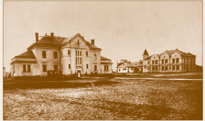
A műhelytelepi hadikórház (a későbbi iskola) épülete

A polgári iskolások száma az 1919/20-as tanévben 55-re 3 ,