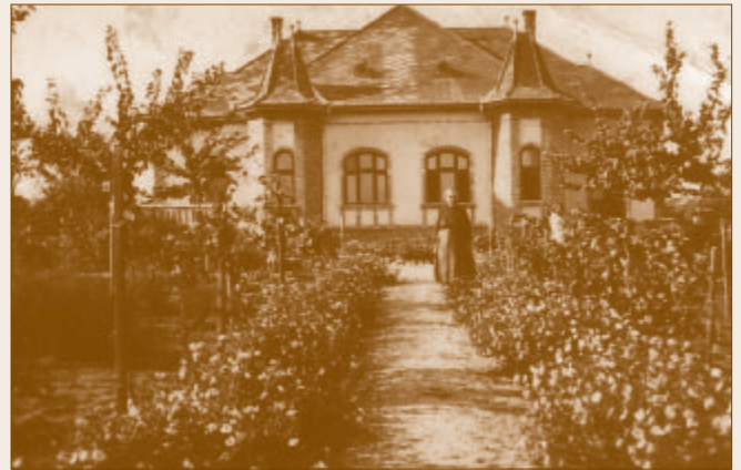
Az Ady Endre utcai családi ház 1933-ban

Életét kitöltötte az iskolai munka, hosszan beteg édesanyja ápolása (édesapját, 32 évesen veszítette el), az Ady Endre utcai nagy kerttel rendelkező ház, valamint a földek igazgatása, majd azok elvesztése. Vidám természete, tanítói munkájának öröme, embertársaihoz való jó viszonya azonban átsegítette a mindennapok nehézségein.