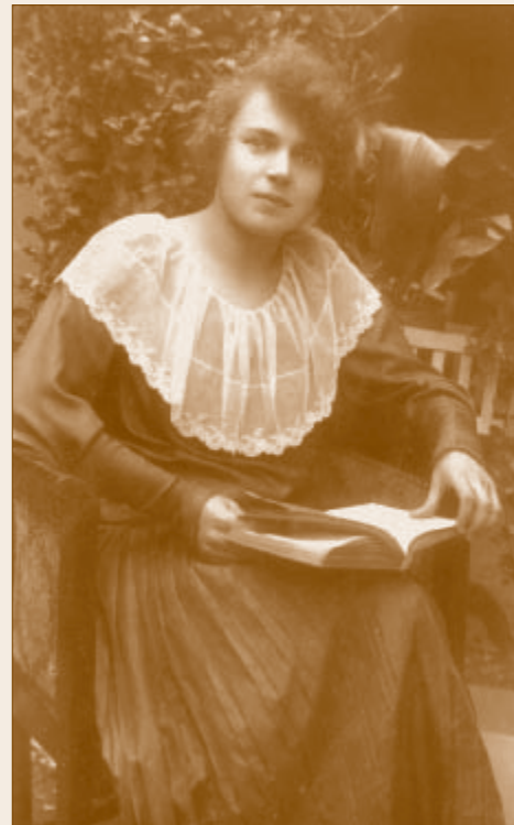
A frissen végzett tanítónő 1919-ben

Még ugyanazon év szeptemberében Dunakeszin, szeretett egykori iskolájában helyezkedett el, először mint helyettesítő, majd 1920. szeptember 1-től már megválasztott, kinevezett tanítóként. 1961-es nyugdíjba vonulásáig, 42 éven keresztül ebben az iskolában dolgozott. Kezdetben 3-os és 4-es koedukált osztályokat tanított, 1935-től csak fiú osztályt is. Az 1940-es és 50-es években felváltva elsős és másodikos fiú-leány osztályokat vezetett.