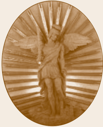
A templomnak ajándékozott szobor