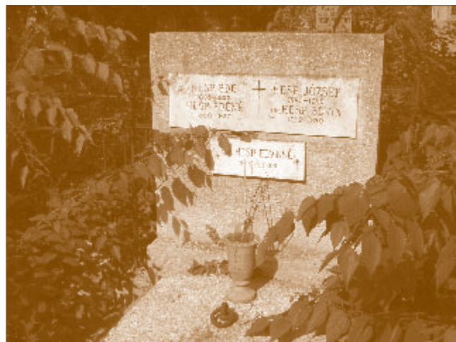
A Hesp családi sír az alagi temetőben

Cikksorozatam következő részében Alag egy másik neves angol famíliája, a Reeves család történetét mutatom be.