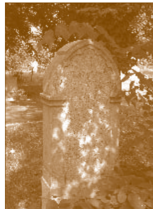
Maria Reynolds sírja