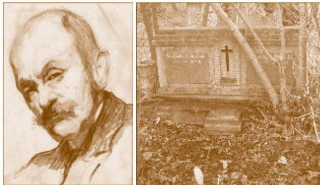
Neogrady Antal önarcképe és sírja

A negyedik tábla 2. sorának 3. sírja Gerő Ferenc (1854–1938), a Földművelésügyi Minisztérium egykori tanácsosának nyughelye. Gerő egyike volt azoknak a tisztviselőknek, akik a fővárosból az akkor már agglomerációs településnek tekinthető, a korabeli viszonyok között olcsónak számító Alagra költöztek. Régi alagi térképeken még megtalálhatjuk az egykori Gerő-villa helyét, amely a mai Kossuth Lajos u. 16. szám alatt állt. Az impozáns épülethez, a visszaemlékezések szerint, medence is tartozott.