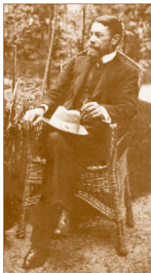
Kleiszner Károly (1864–1936)

család leszármazottai ma is a településen élnek.