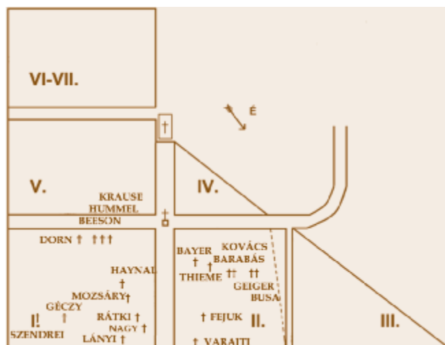
A temető vázlatos térképe a bemutatott sírokkal

Sorozatunk következő, befejező részében a III-as, IV-es és V-ös parcellák neves halottaira emlékezünk.