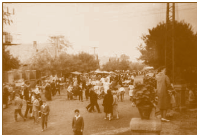
Vásári forgatag a Szent István utcában

A „torkosbúcsú” fénypontja az ünnepi ebéd volt. A háziasszonyok már sokszor szombaton nekiláttak az előkészületeknek, hogy vasárnap kora reggel kezdhesék a sütés-főzést. Sok-sok ételt készítettek minden búcsútartó háznál, hiszen régen nem látott barátok, távol élő rokonok érkeztek az ünnepnapra. Általában azokat látták vendégül, akikhez maguk is el szoktak menni búcsúra, a más faluban lakó szülőt, testvért, katonacimborát. Húsleves, főtt hús tormával, sült hús dinsztelt káposztával és túrós rétes került az ünnepi asztalra, na meg bor, nagy mennyiségben. A kisebb gyerekek nem állhattak sokáig az otthon elfecsérelt időt, vágyakozó sóhajuk után szüleikkel együtt a délután hátra lévő részét a búcsúban töltötték. Az árusok sora a templom előtti tértől indult, és a mai Bajcsy-Zsilinszky úton át a Szent István út Pest felőli szakaszának feléig ért.