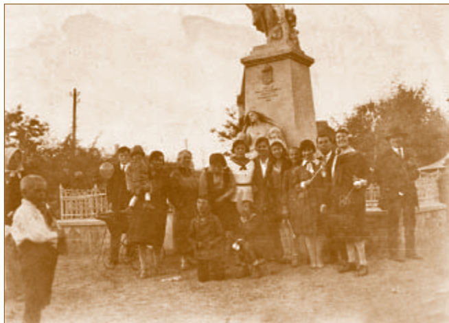
Az 1929-es búcsú közönsége a Hősi emlékműnél

Templombúcsút általában a templom védőszentjének ünnepén, illetve hivatalos nyelvhasználatnál élve, a templom címének ünnepén tartanak. Dunakeszin szeptember 29-én Szent Mihály napon, vagy az azt következő vasárnapon került megrendezésre a „falu” búcsúja. A gyerekek számára azonban már a szombati nappal kezdetét vette a vigasság, mert a körhintát és a hajóhintát már ekkor felállították az I. világháborús emlékműnél, a Kistemplom és Táncsics Mihály utcák találkozásánál.