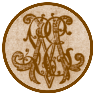
A lovaregylet emblémája a múlt század fordulóján

A Magyar Lovaregylet 1889-ben megvette Alag-pusztát, hogy megépítse első állandó tréningközpontját. A megvásárolt területet északon a Fóti út, keleten az erről letérő és a közelmúltban megszűnt majori bekötő út és az Alagi-major területe, délen a Mogyoródi-patak, nyugat felé pedig a Budapest-Bécs vasútvonal határolta. Az ekkor pusztaként nyilvántartott földön néhány épület állt mindössze, az Alagi-majorban (1) marhaistállók és lakások. Volt egy másik major is a területen, a Nándor-major (2), aminek most Petőfi-telep a neve. Itt napjainkban is áll egy vályogból épült ház, amely már abban az időben is létezett. Ezt a lovaregyleti építkezésektől eltérő építésmód és az a beépített néhány téglá bizonyítja, melyek bélyegei az egylet által vásárolt tégláknál korábbiak.