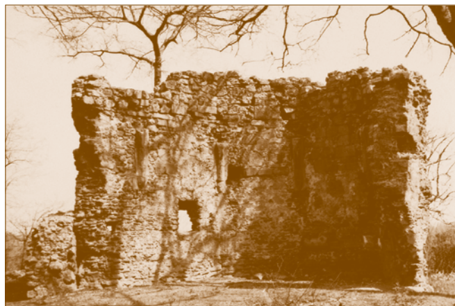
Templomrom az Alagi-majóban

A középkori Alag falu temploma, azaz központja a mai fóti határtól néhány száz méterre nyugatra fekvő rom képében maradt korunkra. Alag bizonyosan létezett már az Árpád-korban is, a régészeti terepbejárások ezt igazolták. Ezt azért kell hangsúlyozni, mert Árpád-kori oklevél nem áll a rendelkezésünkre a községről. 1