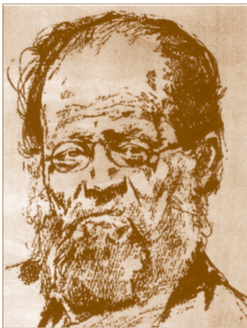
Herrmann Antal (1851–1926)

A magyar néprajz hőskorában, a XIX-XX. század fordulóján, volt e tudománynak egy különös alakja. A hosszú, bozontos hajú, csapzott szakállú, elhanyagolt ruházatú, a társadalmi konvenciókra fütyülő, különc és szórakozott, viszont sokoldalúan képzett, nagy műveltségű, több nyelvet beszélő, a magyarországi és a külföldi előadótermekben mindig szívesen látott kiváló tanárt és kutatót Herrmann Antalnak 1 hívták.