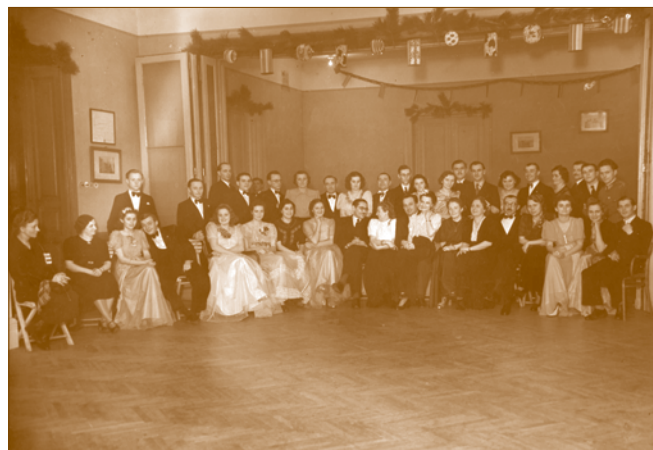
Egy későbbi Pavilon-bál (1911)

A Herrmann Antal Váccal és környékével kapcsolatos írásaira kíváncsi olvasóknak az e sorok írója által összeállított könyv 11 ajánlható, valamint a fő műveinek és a róla szóló könyveknek és cikkeknek az adatait is tartalmazó szócikk, amely a Magyar múzeumi arcképcsarnokban 12 olvasható.