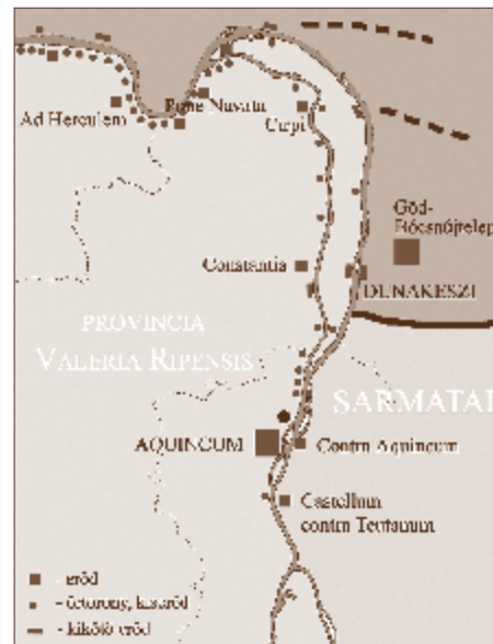
A Dunakanyar védelmi rendszere a 4. században

A Dunakanyar és környéke a katonatisztból lett császár, az „erődépítő” I. Valentinianus (364-375) idején néhány évig a Birodalom történetének sorsfordító színtere lett. A császár erődítési tervei ugyanis nem korlátozódtak a Birodalom határvonalára, hanem a Szentendrei-szigetet és a barbárok földjeit is be akarta vonni a provincia védelmi rendszerébe. I. Valentinianus stratégiai célja az alföldi sánc vonalának előretolása és a Duna túlszéljén, a két sánc közé eső területen egy közvetlen római katonai ellenőrzés alatt álló zóna kialakítása volt, amellyel elválaszthatta egymástól a megbízhatatlan kvádokat és szarmatákat. Az előretolt új katonai terület központi támaszpontját, egy hatalmas, 450 x 300 méter nagyságú, ovális alaprajzú erődöt a mai Göd városa mellett el is kezdték építeni, de a kvádok határozott tiltakozására a munkálatokat leállították. A kvádok sérelmezték, hogy egyoldalúan, megállapodás nélkül került sor az erődépítésre. A tiltakozástól a kvádok királyának meggyilkolásán és véres háborúkon keresztül egészen a császár haláláig ívelő konfliktus mind e nagyszabású terv körül forgott, amely végül sok emberéle-