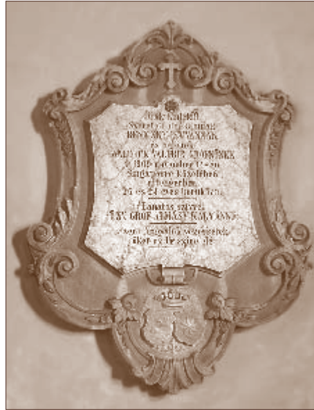
Az emléktábla az alagi kápolnában