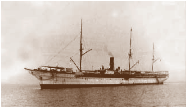
A szerencsétlenül járt La Seyne gőzös