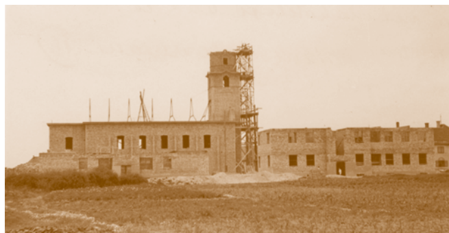
Az épülő templom és lakóházak