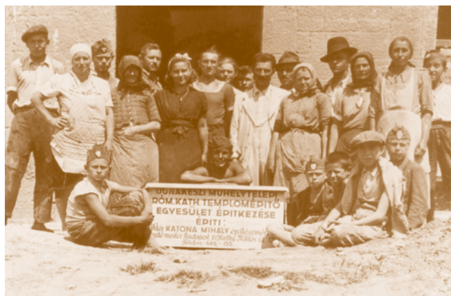
A templomépítő egyesület tagjai