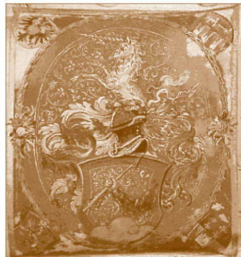
A Wattay család címere 1580 22