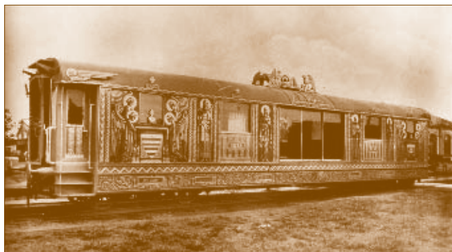
A műhelytelepen készült „aranykocsi”

A Szent István Emlékév székesfehérvári országos dalosversenyén 1938. július 26-án a férfikar aranyérmes lett. Műsorukon Kodály Zoltán Ének Szent István királyhoz című kórusműve is szerepelt.