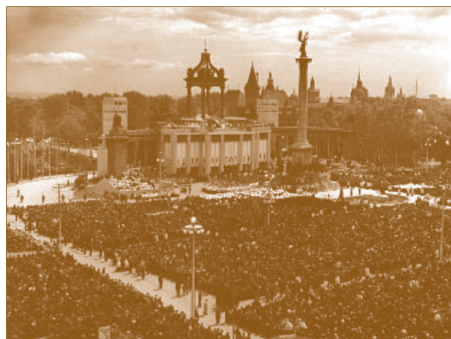
Az Eucharisztikus Világkongresszus főoltára a Hősök terén