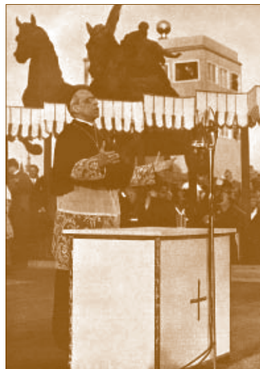
Pacelli legátus a Kongresszus megnyitóbeszédét mondja

A kongresszus központi színhelye Budapest volt. A hozzá kapcsolódó Szent István Emlékév eseményei a Parlament előtti ünnepélyes szentmisével kezdődtek és a Szent Jobb országjárásával folytatódtak. A kettős emlékév 1938. október 8-án Kalocsán záróünnepséggel fejeződött be. A hetven éve történt eseményeket több kiadvány dokumentálta. A váci Püspöki Levéltárban kezembe került A Magyar Királyi Államvasutak Dunakeszi Főműhelyének története című kötet (1940), melyből a következőket tudtam meg: