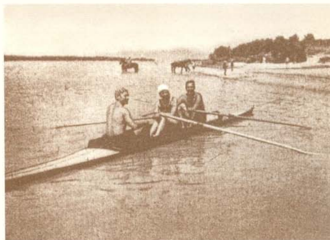
Kikötés Dunakeszi partjainál

Az egyesület 1895-ben elköltöztött a Vámház alól és új parti házat nyitott a budai parton a Császárfürdő, a mai Császár Uszoda előtt. Ez egyben a túrák irányát is megváltoztatta. A Hunnia csónakjai egyre gyakrabban eveztek észak felé, és megkerülve a Szentendrei-szigetet, immár rendszeresen kikötöttek Horányban és a dunakeszi partokon is. A taglétszámban és anyagi erőben is erősödő evezősök idővel elhatározták, a budai bázis mellett egy új telepet is létesítenek. Rövid keresgélés után Dunakeszin akadt meg a szemük, ahol a székesfőváros és a Magyar Lovar Egylet segítségével területhez jutottak a rév mellett.