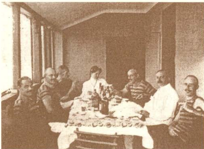
Ebéd a vendégház tornácán

A szezon március közepén kezdődött, és egészen késő ősziig tartott. Ebben a hét-nyolc hónapos időszakban nem múlt el úgy vasárnap, hogy néhány vagy akár tucatnyi hajó meg ne tette volna a 2,5-3 órás utat a Császárfürdőtől Dunakesziig. A rendszeres hétfégi kirándulásain kívül a Hunnia nagyobb ünnepeit is rendre itt tartotta. Ezek közé tartoztak a csónakkeresztelők és az újoncavatások. Utóbbi valóságos szertartás volt, amin az egyesület tagjai különféle maskarákat öltöttek magukra, miközben az újoncoknak különféle tréfás próbatételeken kellett átesniük.