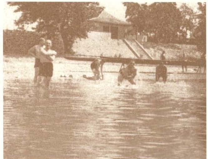
Fürdőzés a „Pagoda” előtt 1930-ban

Az évad kiemelt eseménye volt az alagi szüret is, amin szintén részt vett az egész Hunnia. Ilyenkor egy helyi gazdával megállapodtak, és a maguk szedett szőlőt megvéve, azt hajóval a budai csónakházba szállították. Itt készítették és tették hordóba a mustot, a borból pedig egész évben gazdálkodhatott a mulatóságokra mindig kapható társulat. Az évadot is rendszeresen Keszin zárták egy disznótorral, amelyet az ünnepek előtti napokban tartottak.