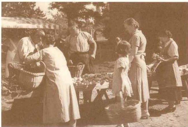
A piac a községháza mellett

Petanovics fotóinak egy jelentős része a korabeli alagi és dunakeszi világ jeleneteit örökíti meg. Az itt bemutatásra kerülő képek is ezek közül kerültek ki.